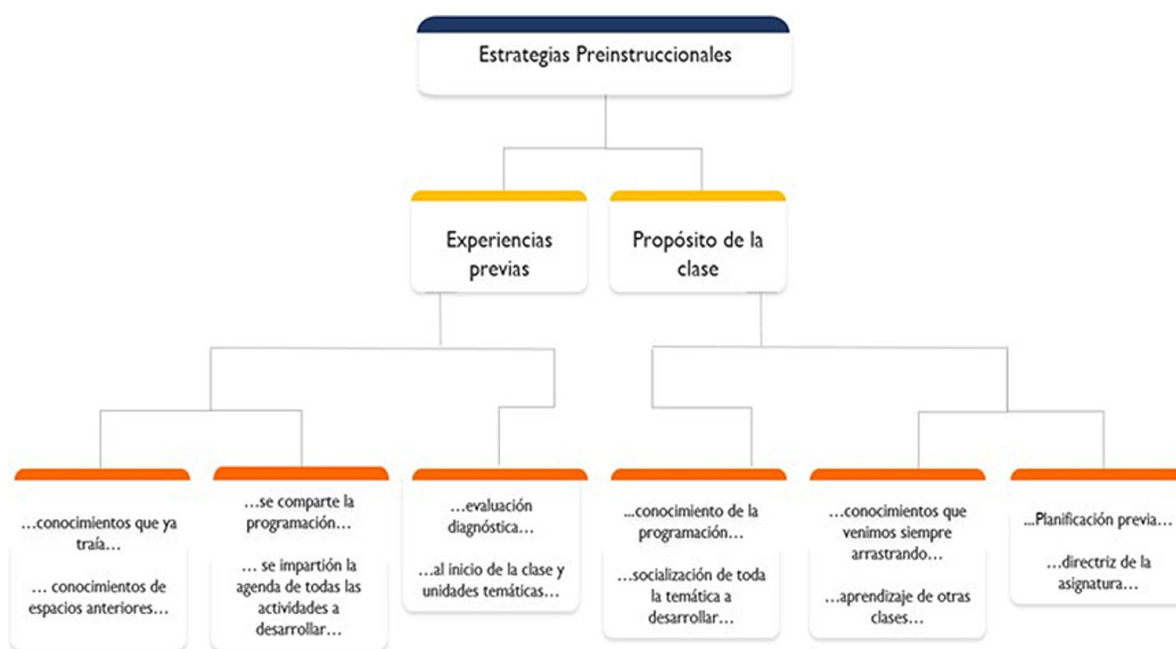
Figura 1. Estrategias desde la visión de los estudiantes