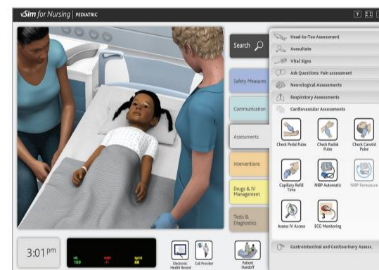
Figura 4. Software PV.