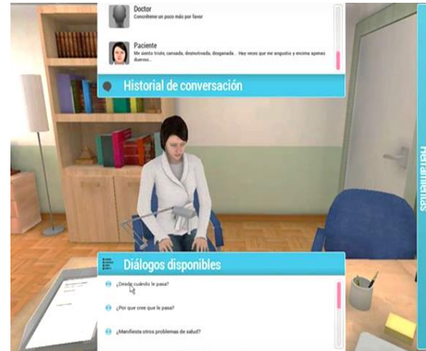
Figura 2. Interacción PV.

Gómez y Narváez (2012), señalan que esta metodología atraparará la atención del estudiante y convertirá su experiencia con el PV en un momento agradable y memorable. Con ese fin se recomienda tener un equipo interdisciplinario para el desarrollo de los casos, de tal manera que puedan ser lo más integrativos posible.