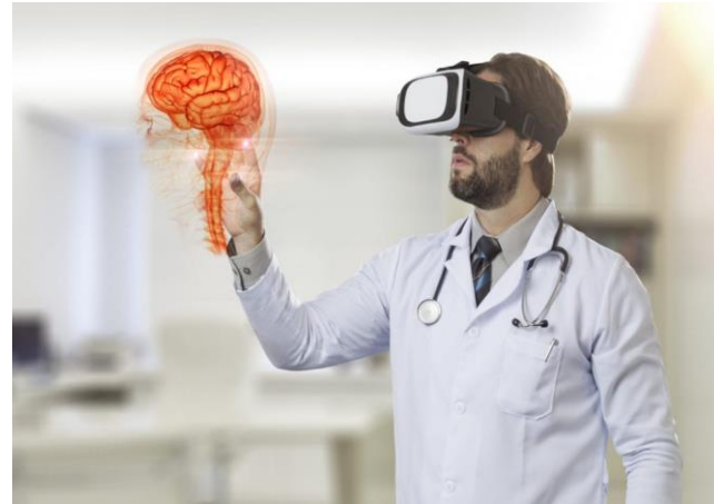
Figura 6. . RV