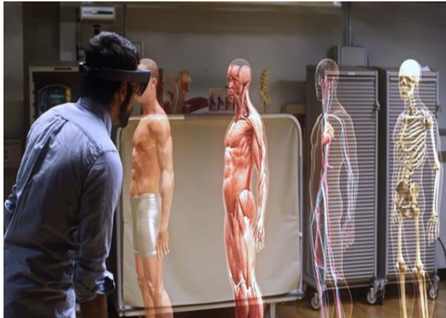
Figura 5. 5. RV; Fuente: www.newtral.es