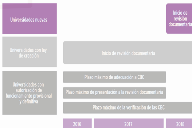
Figura N°3. Plan de implementación del licenciamiento institucional

El licenciamiento institucional, proceso mediante el cual se da autorización a las diferentes universidades, para que en base a estándares básicas de calidad puedan brindar grados y títulos, además de cumplir un plan de implementación progresivo según cronograma dado por esta instancia. Se indica que a partir de enero del 2019 ninguna universidad podrá funcionar sin licenciamiento institucional.