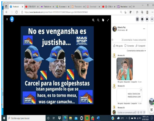
Pagina Facebook Bolivia Libre sin Evo 15